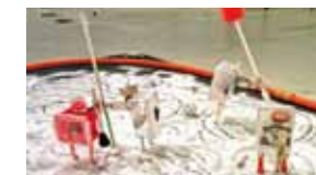
『シンドウさん』自動お絵かきメカ (アルミ プラスチック モーター 電池 筆ペン)