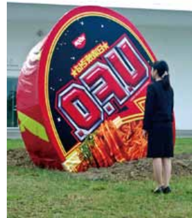
w#167 UFO(未確認墜落物体)/2015/塩ビシートに油性インク、木材他