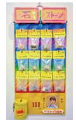
『そのへんでデキトーに拾った石ころ を100円で売るセット』 (2017年/石 MDF LEDライト等)