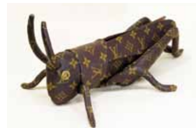
w#93 バッターもん LV/2007/解体したブランドバッグの生地ほか