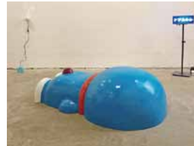
w#205 ドザえもん/2017/FRP、ウレタン塗装