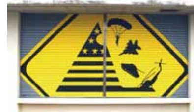
N5#326 落米のおそれあり/2017、シャッターにウレタン塗料 あいちトリエンナーレ2019「表現の不自由・その後」にて展示予定

1985年愛知県出身 / 大阪府在住 2010年 大阪芸術大学大学院芸術研究科芸術制作専攻卒業